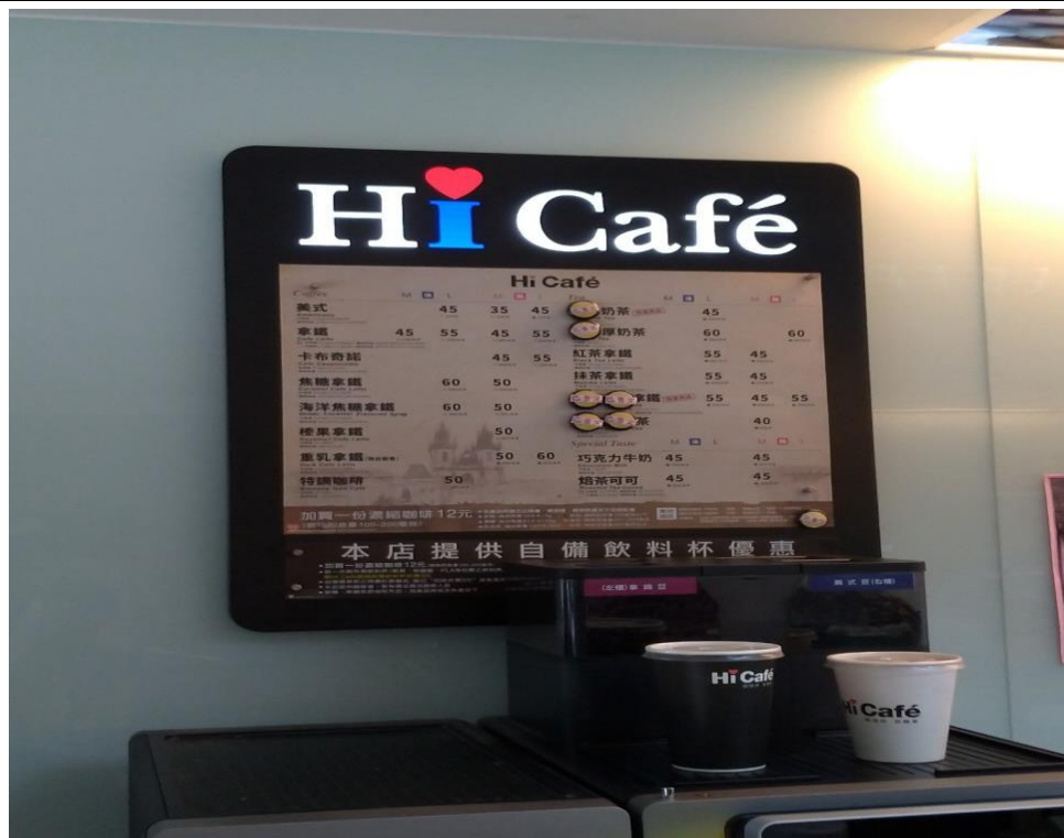
便利商店自備環保杯優惠獎勵