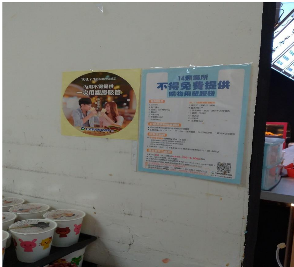
餐廳明顯處公告不提供吸管及塑膠提袋